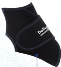
Chevillère de maintien en néoprène avec scratch de fixation