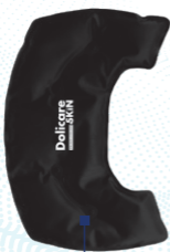
Coussin de gel thermique

Soulage : Les gonflements et inflammations, les blessures sportives, les entorses et contusions articulaires, les spasmes musculaires.